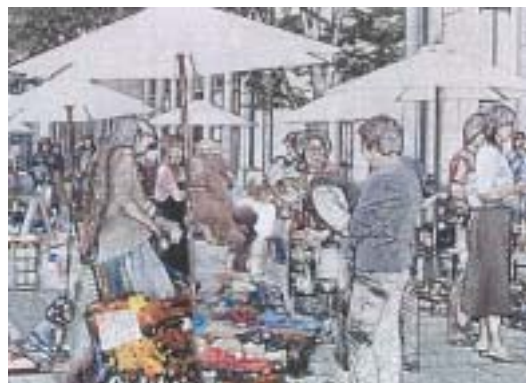
<楽市ストリートのイメージ>

販売主体としての楽市楽座組合（仮称）の結成。（千葉の海産物、農作物、花、料理のアドバイスブース等）